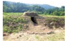
野呂 祐人 【インスタレーション】