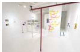
内田 聖良 【インスタレーション】