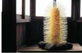
國政 サトシ 【インスタレーション】