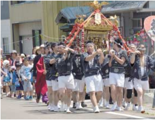
暑さに負けず威勢よく御輿を担ぐ若衆

後ろを歩いた子ども御輿も、若衆に負けないぐらいの大きな声で「ワッショイ」の声を響かせ、集落内を巡行しました。