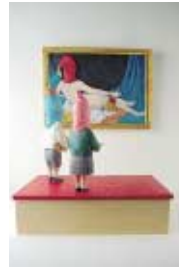
尾花 賢一 【彫刻】