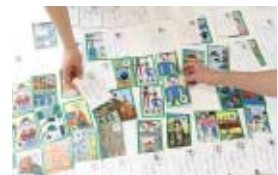
かみこあアニメ研究会 【映像】