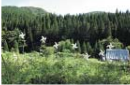
空気 ひとし 【インスタレーション】