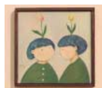
長門 あゆみ 【絵画】