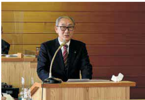
3月定例議会で説明させていただきました

また、人口減少対策の一環としては、転入してきてくださる方に一人10万円を、そして、お子さんには、一人30万円を支給して、学校などの転入の援助をさせていただきます。ハード事業で大きいのは、コアニティの近くに、木造による一部2階建ての保育園の建設工事があります。