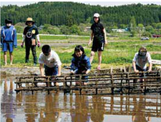
慎重に型枠で印を付けました

時間が経つにつれ、植えるスピードが上がリ、あちこちにいる児童から「こっちにも苗ください」と大きな声が響き、田んぼの周りにいる先生方から投げられた追加の苗を上手に受け取っていました。