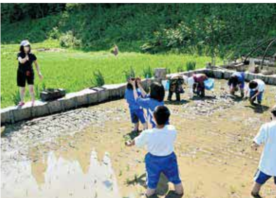
うまく取れるかな