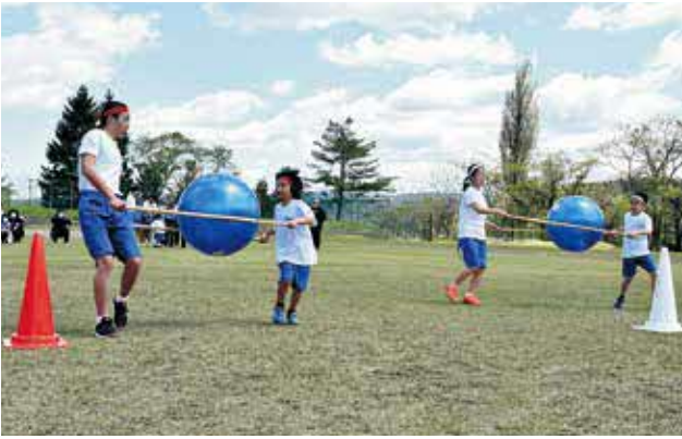
小中学生による競技「じょうずに運んでね」