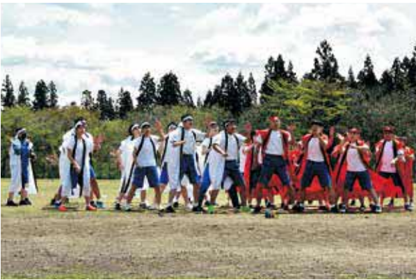
よさこいソーラン