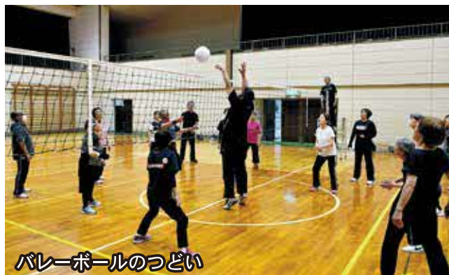
バレーボールのつどい