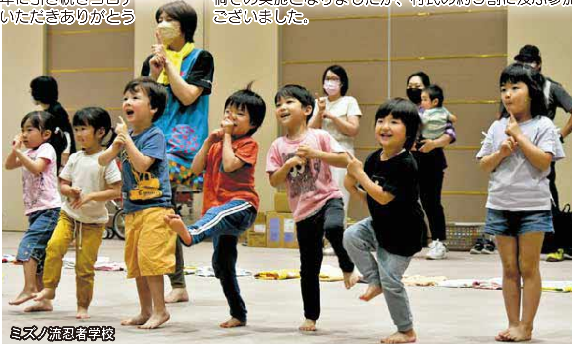
ミズノ流忍者学校