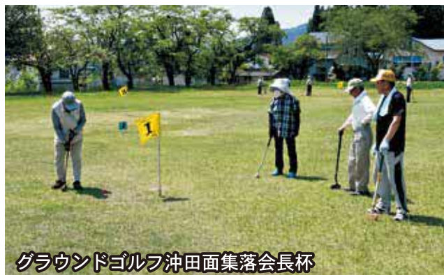
グラウンドゴルフ沖田面集落会長杯