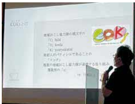
COKsの活動の事例発表をしました！

コアニティーにて、大館市・北秋田市・上小阿仁村の協力隊と知事が意見交換するイベントが行われ、事例発表と参加者として参加しました。