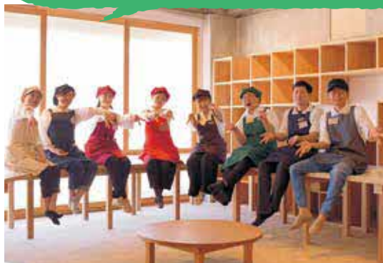
COKsのメンバーのみなさんと

秋田県内地域おこし協力隊の任意団体COKs(コックス)主催で、“あきたコス”イベントを能代市で開催させて頂きました。“あきたコス”は秋田の特産品を2種類以上使って作るタコスで、上小阿仁村からはズッキーニときゅうりをタコスのサルサソースに使用し、食用ほおずきを使ったシェイクもメニュー開発し、提供させて頂きました。この日PRした特産品は6市町村分12種類！参加して頂いた協力隊も7市町村8名とどんどんつながりも増えています。