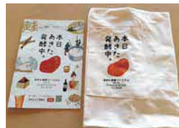
発酵伝導士のエプロンです

あきた発酵伝導士は、秋田の豊かな発酵食文化を伝承し、その魅力を県内外に情報発信する役割を持っています。今回の講座では秋田の最新発酵事情と、実際に発酵の現場で活躍されている湯沢市石孫本店の方からお話を伺いました。秋田県内では各味噌蔵に住み着いている酵母を使った新たな味噌づくりが進んでいるそうです。新しい秋田の味噌を食べられる日が楽しみです。私の活動としては、秋田の発酵食品、味噌、酒粕、甘酒などと上小阿仁村のこはぜやほおずき、えごま、米粉などを使ったグラノーラやお菓子作りのワークショップを今後も開催予定です。興味のある方は、ぜひご参加ください。