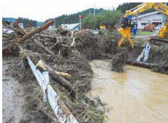
流れてきた大量の流木(上仏社地区)

一つは成人式ができるかということでした。コロナ禍で実施が危ぶまれましたが、一生に一度の式典に県外からも帰省したいという声があり、