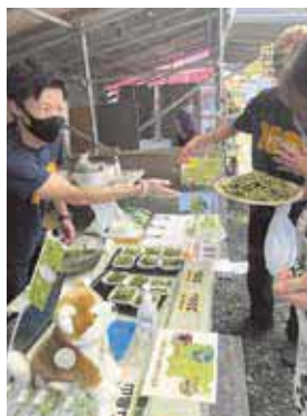
早口市日での朝採れ枝豆の販売

今年「秋田の枝豆は美味しい」ということをより多くの方に実感していただけるよう、管内のイベント等で「朝採れ枝豆」を提供する取り組みも行っています。寒暖差が大きくなる晩生期の品種は特に美味しくなりますので、皆さまもこの味を楽しみながら、自信をもって県外の方におすすめしてみてください。