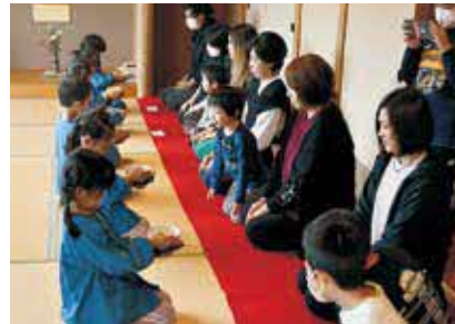
→ 保護者とお茶の体験