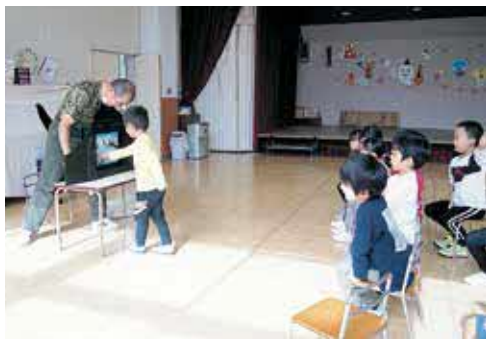
保護色について学びながら、絵の中から動物を探しました

図書館ボランティアが、毎月一回、保育園での読み聞かせを行っています。今回はゆり組さんとひまわり組さんに行きました。