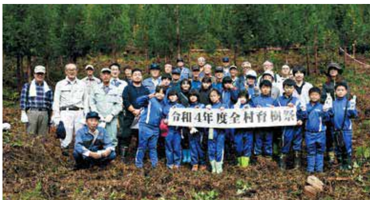
最後にみんなで記念撮影

来年度以降も、森林資源の整備を図れるように育樹等の事業を行っていく予定としています。