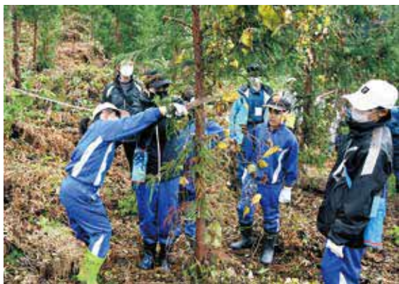
声掛けしながら枝打ちしています

小学生は代わる代わるのこぎりを使い「こつちの方やれるよ」など声を掛けしながら枝打ちしています