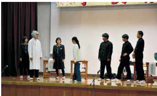
中学校3年生劇「運勢ポイント」

きことに積極的に取り組み、やり遂げることができました。学校祭を無事終えることができたのは、保護者の皆様や地域の皆様のおかげです。これからも感謝の気持ちを忘れず、自分たちができることを根気強く元気に取り組んでいきたいと思えます。」と閉会の挨拶をしました。