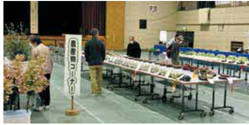
展示物を見学する来場者