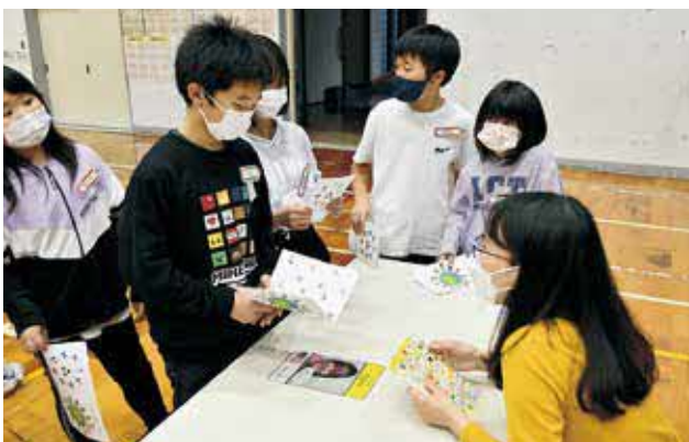
児童一人ひとりが英会話したフリーセッション

児童たちは初めに自己紹介し、自分の好きな食べ物や趣味などを話した後でALTに質問し、積極的にコミュニケーションを図りました。児童たちは作業や遊びなどを通じて楽しく英語に触れることで、最初から最後まで緊張せずに取り組むことができました。