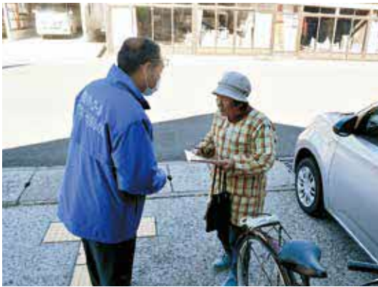
啓発用品を配布する防犯協会員

北秋田警察署からの依頼により、村防犯協会と合同で実施したものです。多数の来局が予想される年金支給日に合わせ啓発をすることで、住民の防犯意識の向上が図られました。「知らない電話は出ないようにしている」「携帯やネットを一切使わないから大丈夫」という住民もいましたが、最近県内では特殊詐欺被害が後を絶ちません。電子マネーの購入などの身に覚えのない電話がかかってきたら、まずは詐欺を疑いましょう。