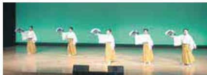
← 会による鏡栄会による踊り