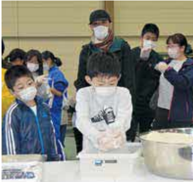
米の重さを当てるイベントも行われました

また、トレーニングセンター前ではハシゴ車体験が行われ、子供たちは普段触れることのないハシゴ車に大興奮でした。