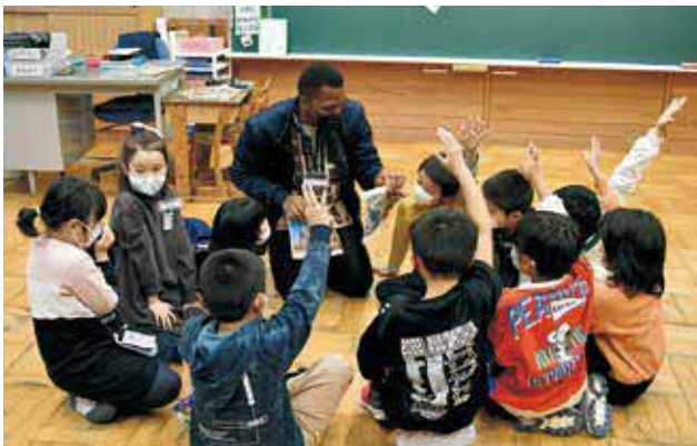
ALTの質問に元気に挙手して答えています

ビーズブレスレット作りやお菓子作り、マレーシアの伝統的な遊戯などを体験し、楽しみながら英語や異