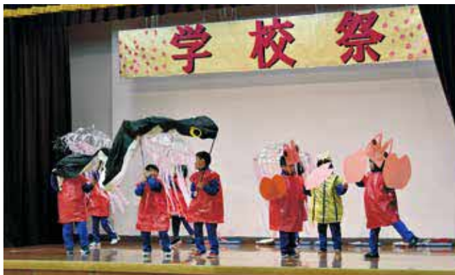
小学校1・2年生劇「スイミー2022」

日頃から練習した成果を発揮し、堂々と元気に演目を発表しました。また、ホールには児童生徒たちが作り上げた作品も展示されました。保護者からは、児童生徒たちの発表が終わるたびにたくさんの拍手が送られ、最後まで元気に発表を行っ