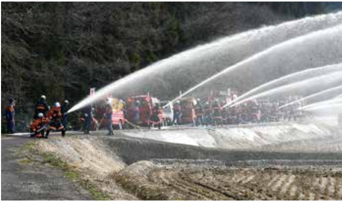
昨年の一斉放水訓練の様子

村の森林資源や農業資源、水資源を利活用することで、地球のため、世界のために、脱炭素化に微力ながら、貢献させていただくものです。