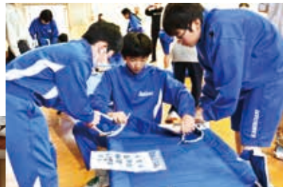
緊急用ベッドを設置する生徒

避難所設置訓練に参加した生徒は「ベッドの組み立てが難しかったので、今回でコツを掴めてよかったです。」「一般参加の住民の方は「初めて参加したが、いざという時の助けになる体験ができた。」「と感想を述べていました。