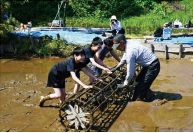
型枠を転がし苗植えの目印をつけます

児童たちは「田んぼの中は、ひんやりしていて気持ちよかった。」「思っていたよりも歩きにくく難しかった。」「楽しかったのでまたやりたい。」「と感想を述べていました。秋の収穫を楽しみに、全員が頑張って一本一本丁寧に稲を植えました。