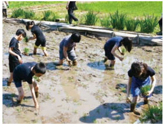
夢中で稲を植えています