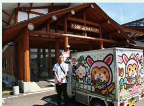
移動販売車と撮影

村という豪雪地で地域おこし協力隊となり、デマンド交通の運転手としても勤務しました。ですから、雪国での生活や運転に大きな不安はありません。また、栄村の中でも「秋山郷」と呼ばれる、役場などがある中心部とは30分以上離れ、山を上った飛び地で暮らしていたため、上小阿仁村の環境にはそれほど不便を感じてはいません。その栄村でのデマンド交通に携わった際、高齢の方が病院への通院ついでに近くのスーパーなどで買い物や散歩、さらに雨の日には傘も、といった姿を目にしました。幸い、お宅の前までお迎えやお送りができる形での運行だったため、運転手の私が、玄関までお荷物をお持ちするというのができていました。が、あれが、私の理想の仕事の形だったのかもしれない。 あれから数年の月日が経ち、長野から戻った東京でコロナの時期を過ごしていくうちに、やはり、私が私らしくいられる(やりたい)ことを仕事にできて幸せを感じられるのは、都会ではなく地方での暮らしなのだろうなと漠然と思うようになり、縁あってたどり着いたのが、ここ上小阿仁村でした。ここだけの内緒の話ですが、正直に言いますと、「もう雪国はいいかな」と思っていました。ですが、そこはもう、運命なのでしょう。