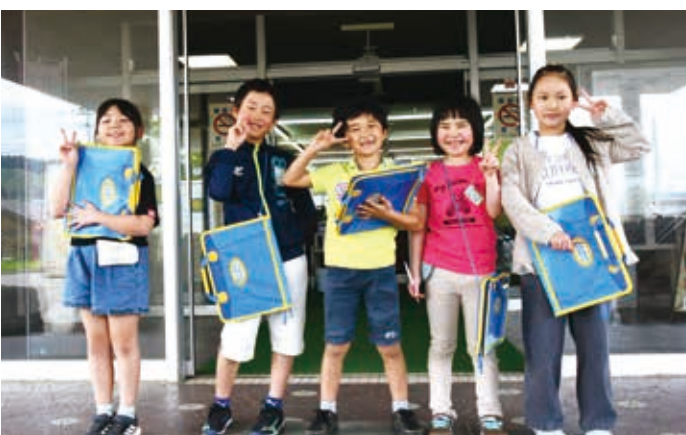
元気にあいさつし見学を終えました

役場では、各課の業務内容についての説明を受けた後、庁舎内を一周しました。村長室や議会の議場へ入ると、わくわくした様子で「大きなイスに座れてうれしい。」「マイクがたくさんあってびっくりした。」「と感想を述べていました。