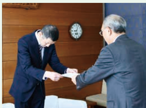
委嘱状を受け取る様子

う。そして、「また雪国」なのが自分らしくもあるのだな、とも感じます。 私自身、一昨年、謎の肺炎で入院し、また、日常的にも身体の衰えを感じるが増えました。「自分が高齢になった時、運転もできなくなったら買い物に行けないよな」と、いつになく真顔でそう思ったことが、上小阿仁村での移動販売を志したきっかけでもあります。長野の山奥でもそうでしたが、少し違った目線で物事を考えると、何十年後かの自分だったら、「こういう事に困っているだろうな」や、「こんなサービスがあつたらいいな」につながってきます。そ