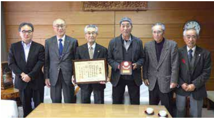
受賞報告に来庁した上小阿仁村老人クラブ連合会

この表彰授賞式において、上小阿仁村老人クラブ連合会が優良老人クラブ連合会表彰を受賞しました。