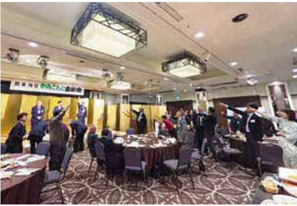
じゃんけん大会の様子