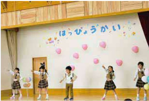
ゆり組ゆうぎ「拝啓、少年よ」

園児たちは、元気いっぱい歌や踊りを披露し、成長した姿や温かい絆を保護者や地域の方に届けることができました。