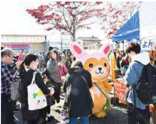
ブースで上小阿仁村をPRするこあびよん

こあびよんはステージイベントにも出演し、ダンスなどを披露して来場者を楽しませました。