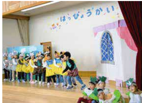
劇遊び「おおきなかぶ うんとこしょ！」