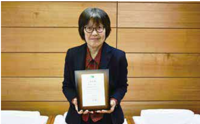
受賞報告に来庁した上小阿仁村スポーツ推進委員会

この表彰授賞式において、上小阿仁村スポーツ推進委員会が全国スポーツ推進委員連合優良団体表彰を受賞しました。