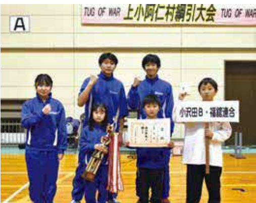
優勝した小沢田B・福館連合