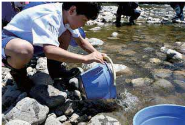
小阿仁川へ放流する児童

稚アユについて、児童たちは「小さなアユがかわいかった」「思っていたよりも泳ぐのが早かった」と感想を述べました。