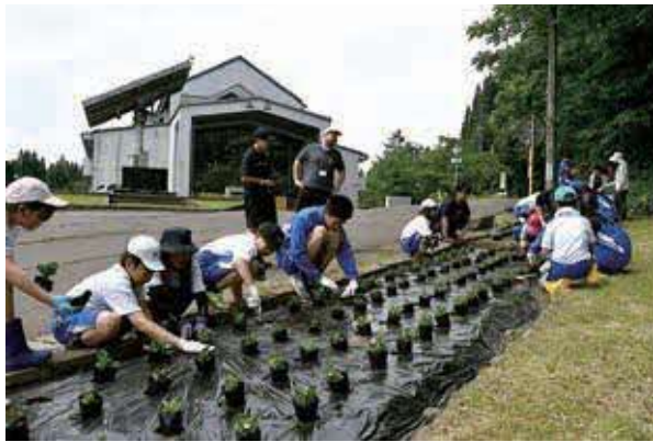
協力して苗を植える様子

全校児童・生徒で協力し、ベゴニアの苗を学校前の花壇に植えました。植えた花の苗は、児童・生徒が水やりや草取りを行い、心を込めて育てていく予定です。