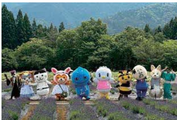
キャラクター大集合

「全国からミズモのお友達キャラクター大集合」のコーナーでは、美郷のミズモ（美郷町）、ニヤジロウ（秋田）、松戸さん（千葉県松戸市）、こーた（東京都江戸川区）、龍王さくらちゃん・ウルフじいじ（三重県津市）、原宿みっころ（東京都渋谷区）、ピヨ丸（神奈川県相模原市）と共演し、多くの来場者との交流を通じて会場を盛り上げました。