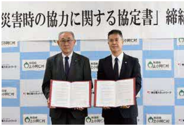
協定書締結の様子