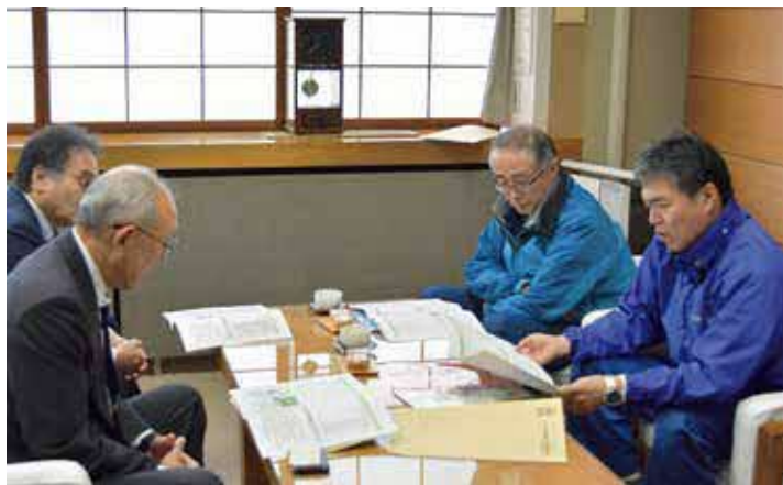
林野庁国有林野部の長崎屋部長が来訪されました

私からは、民間事業者と連携した小水力発電や林道整備、治山ダム、防災ダムなどの取り組みを通じて、産業振興を応援していただけるようお願いしました。