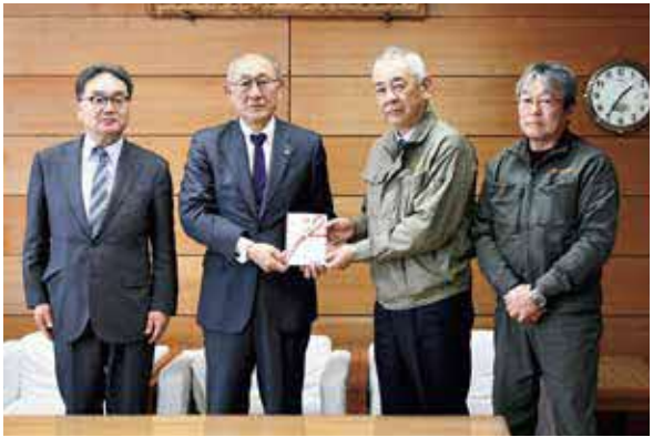
株式会社北日本鉄工クマ捕獲用箱わな贈呈式の様子

この制度は非常に有利なため、国や県の予算には、「順番」や「限度額」が設けられています。